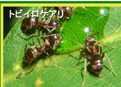
トビイロケアリ 2.5~3.5m 胸部に比べ頭部や 腹部が太い 体表に立毛が多い