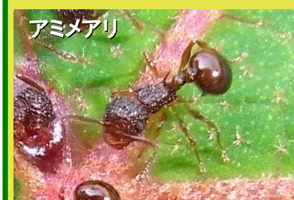
アミメアリ 2.5mm 背面から見て腹端は丸 い 頭部・胸部に網目状のしわ