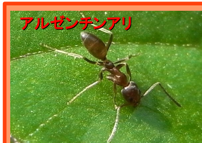
アルゼンチンアリ 1.5~2.0mm ほっそりした体型 体表に立毛はほとんど無い