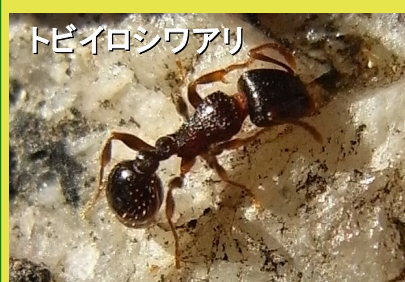
トビイロシワアリ 2.5mm 頭部は四角張り頭でっ ちな印象