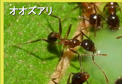
オオズアリ 3.0mm(大型働きアリは4.5mm) 胸部は頭部や腹部より明るく二色性 足が長い 巨大な頭部を持つ大型働きアリ(写真右)がいる